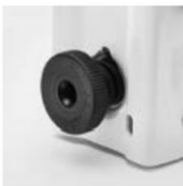
Regulowane tylne stopy

Składany wspornik do klimatyzatora MS 253 renomowanej firmy RODIGAS został wykonany z wysokiej jakości stali oraz pokryty białym lakierem, dzięki czemu zapewnia wysoką odporność na korozję oraz estetyczny wygląd. Dzięki zastosowaniu belki z poziomnicą oraz regulacji poziomej, montaż wspornika MS230 jest niezwykle prosty oraz ułatwia dopasowanie ramion do praktycznie każdego agregatu o mocy 3,5 - 5 kW.