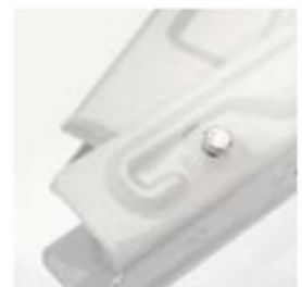
Wstępnie zmontowane wsporniki

Zestaw zawiera niezbędne elementy montażowe tj.: