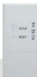
Moduł WiFi RB-N I 055-G